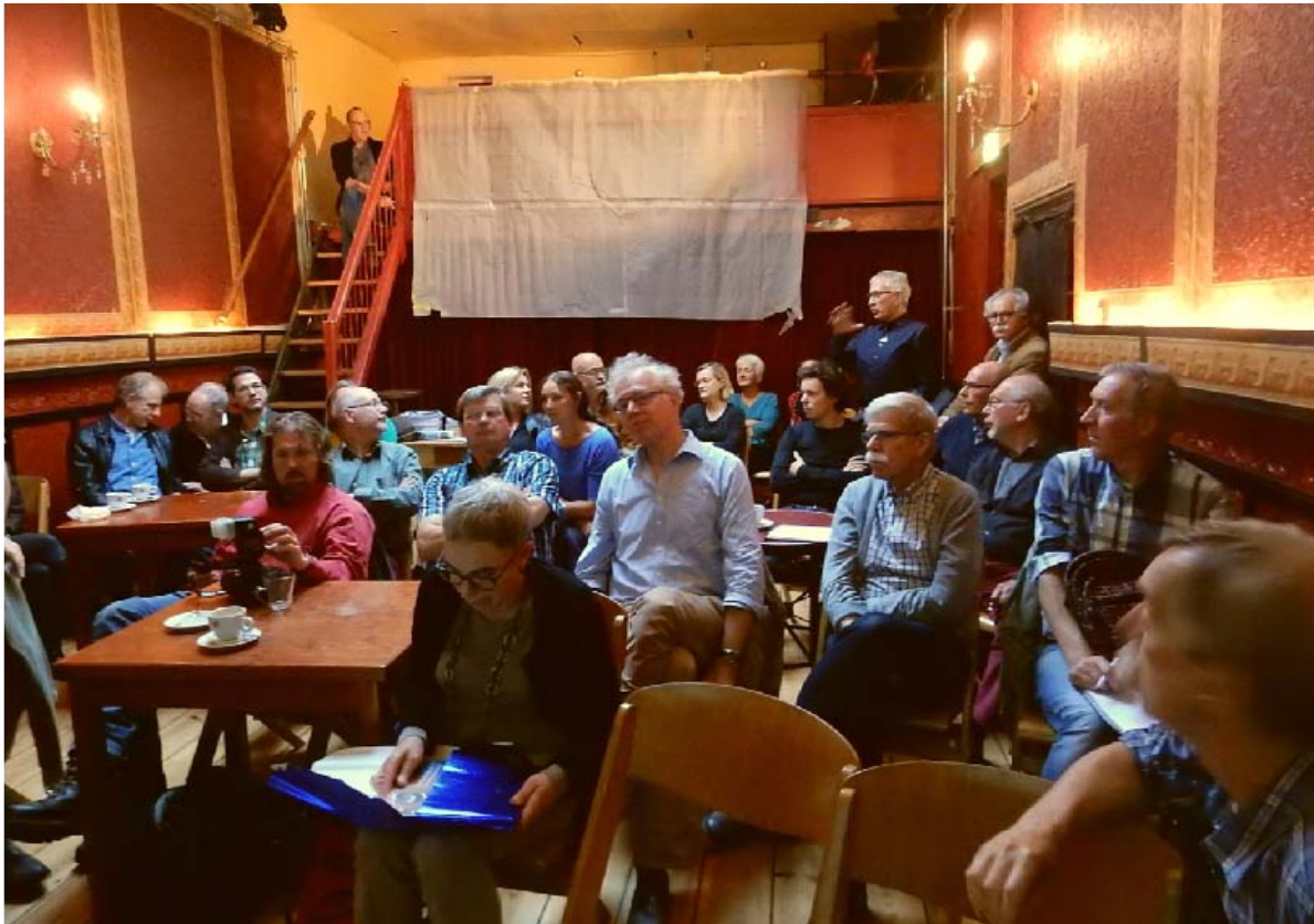
Roode Bioscoop: uitwisseling van ervaringen